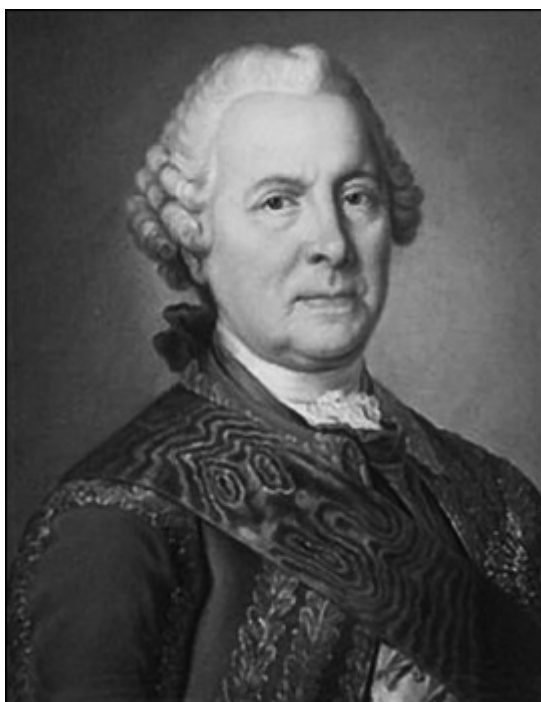
Б.-Х. Минин. Неизвестный художник