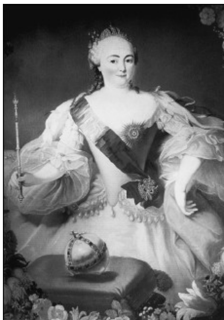
Императрица Елизавета Петровна. Фрагмент. Художник К.Г. Преннер