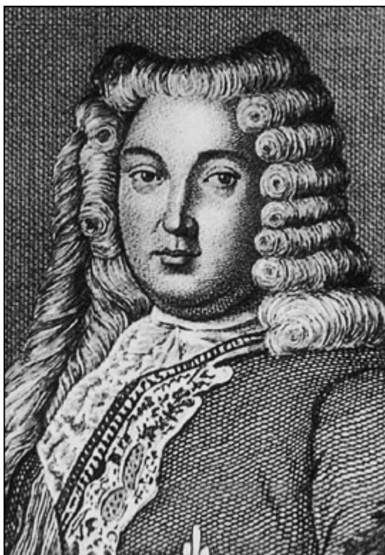
А.И. Остерман. Гравюра XVIII в.