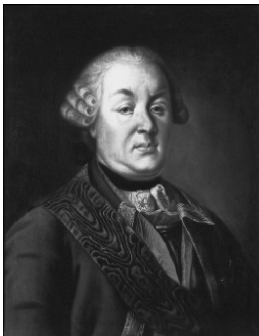
Портрет генерал-фельдмаршала А.Б. Бутурлина. Неизвестный художник