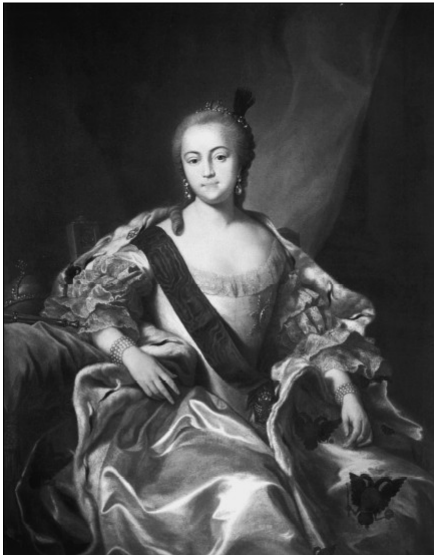
Императрица Елизавета Петровна в маскарадном costume. Художник Г.-К. Гроот