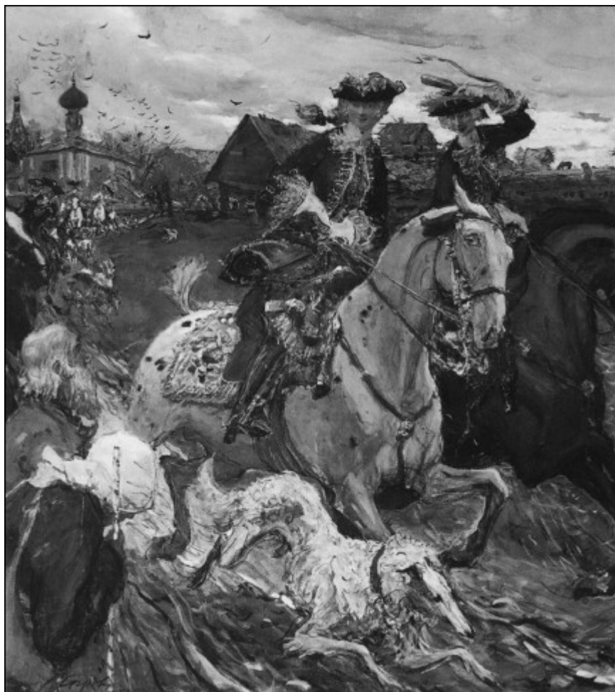
Выезд императора Петра II и царевны Елизаветы Петровны на охоту. Художник В.А. Серов