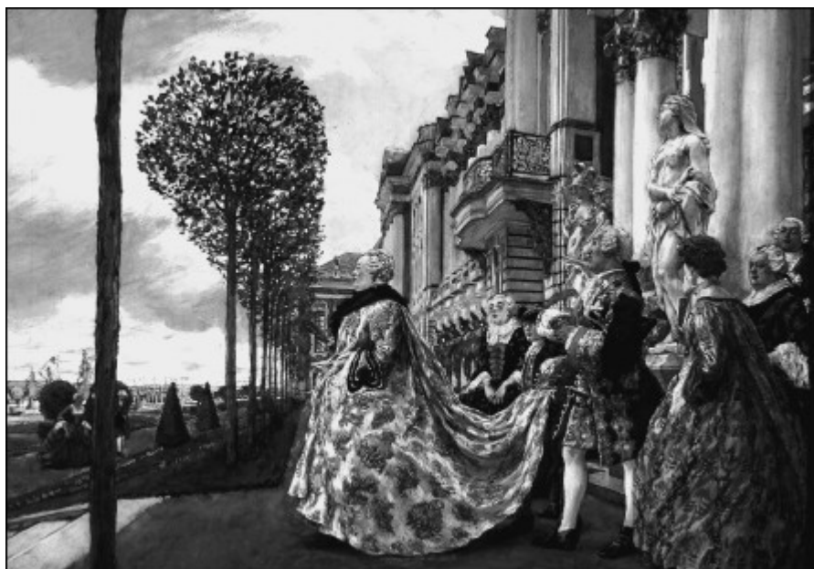
Императрица Елизавета Петровна в Царском Селе. Художник Е.Е. Лансере