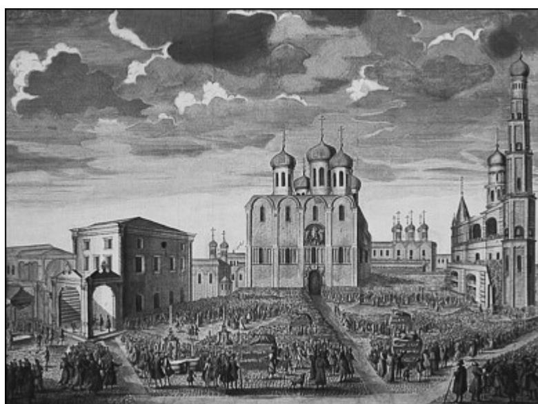
Вид Соборной площади Московского Кремля во время коронационных торжеств Елизаветы Петровны. Художник И.А. Соколов