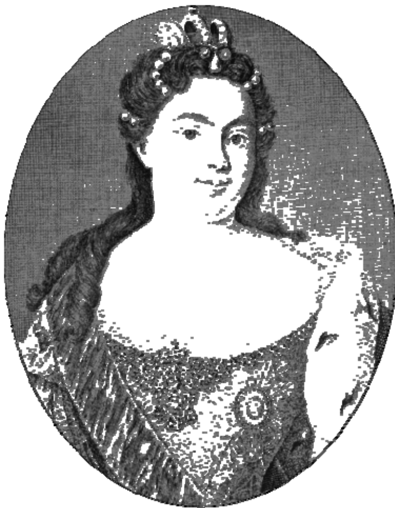
Императрица Екатерина I, мать Елизаветы Петровны. Гравюра XVIII в.