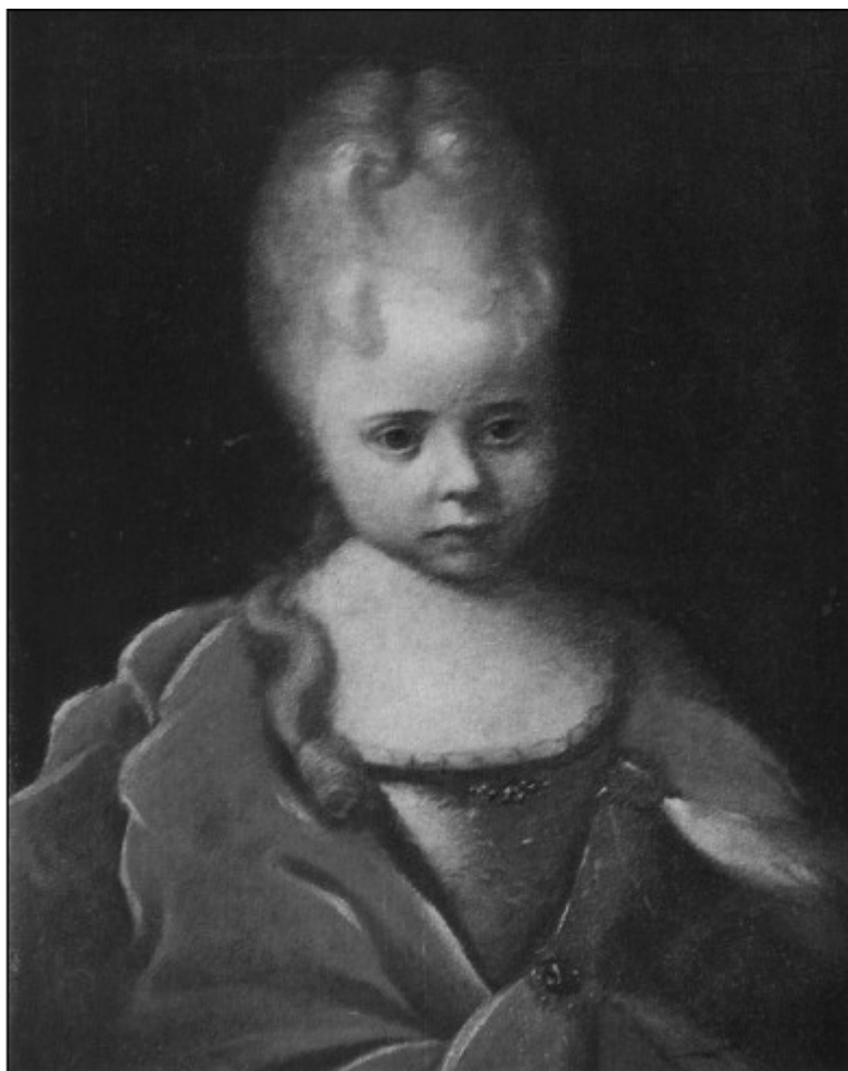
Портрет Елизаветы Петровны ребенком. Художник И.Н. Никитин