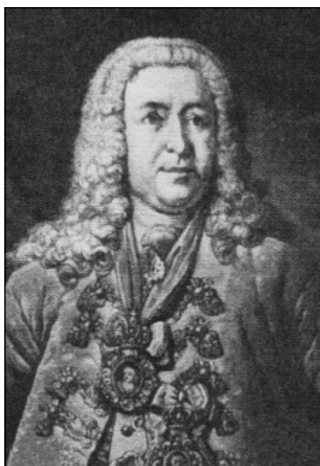
И.-Г. Лесток, лейб-медик императрицы Елизаветы Петровны. Неизвестный художник