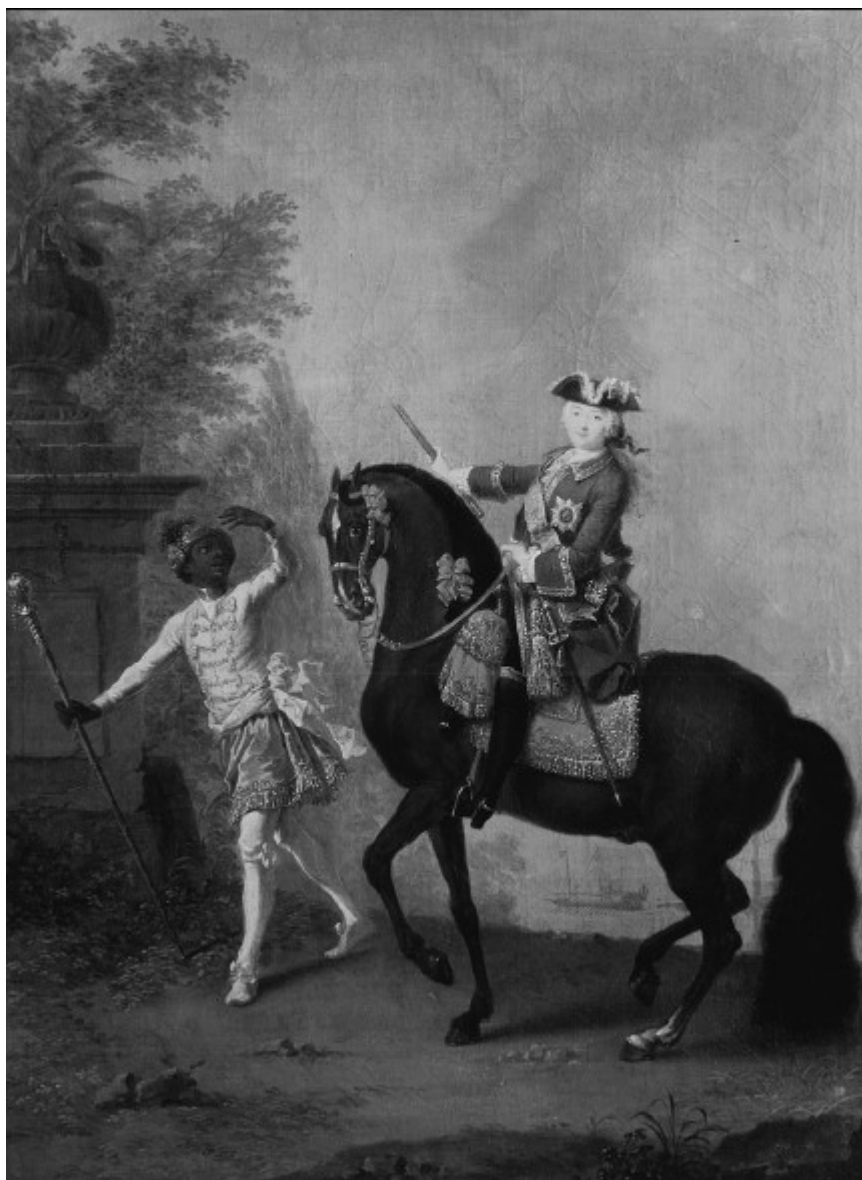
Елизавета Петровна на коне в сопровождении арапчика. Художник Г.-К. Гроот