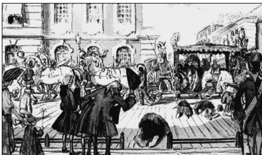
Прогулка Елизаветы Петровны по знатым улицам Санкт-Петербурга. Художник А.Н. Бенуа