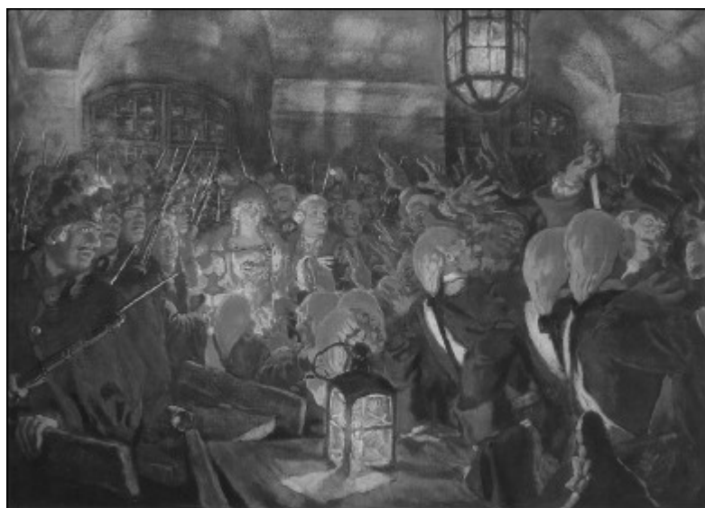
Цесаревна Елизавета Петровна и преображенцы в кордегардии Зимнего дворца в ночь на 25 ноября 1741 года. Художник Е.Е. Лансере