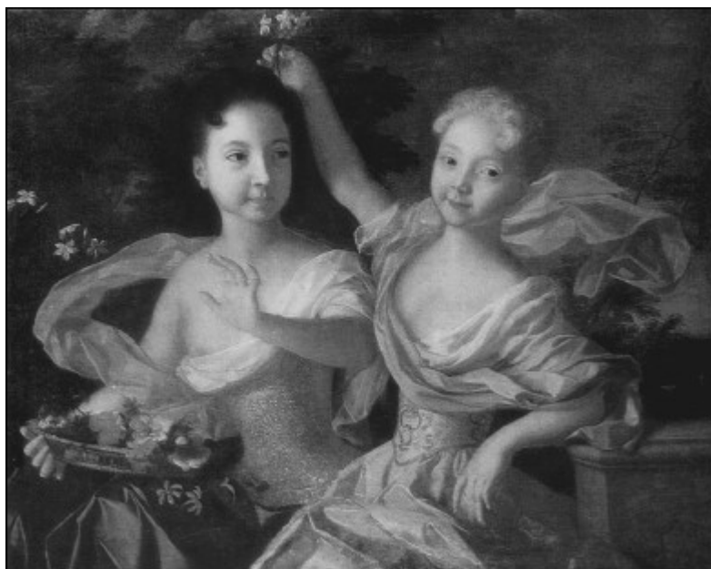
Царевны Анна Петровна и Елизавета Петровна. Художник Л. Каравак