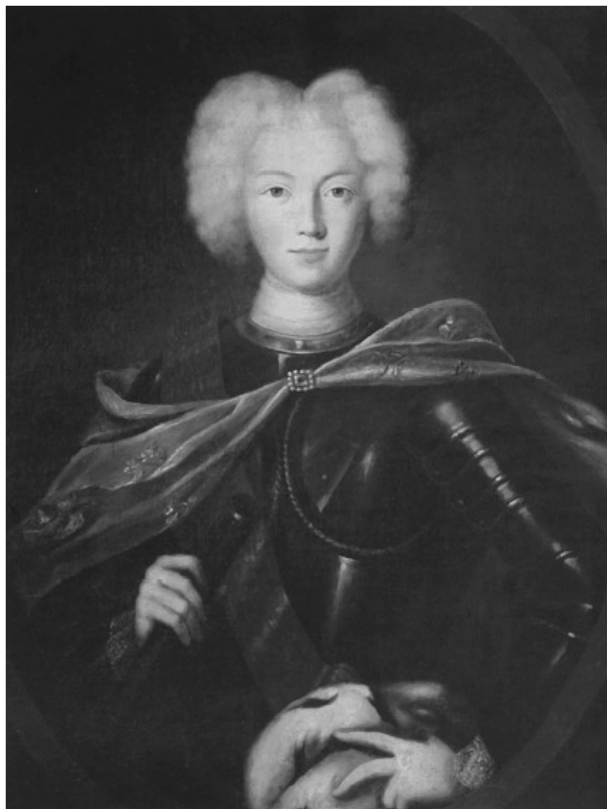
Император Петр II. Неизвестный художник