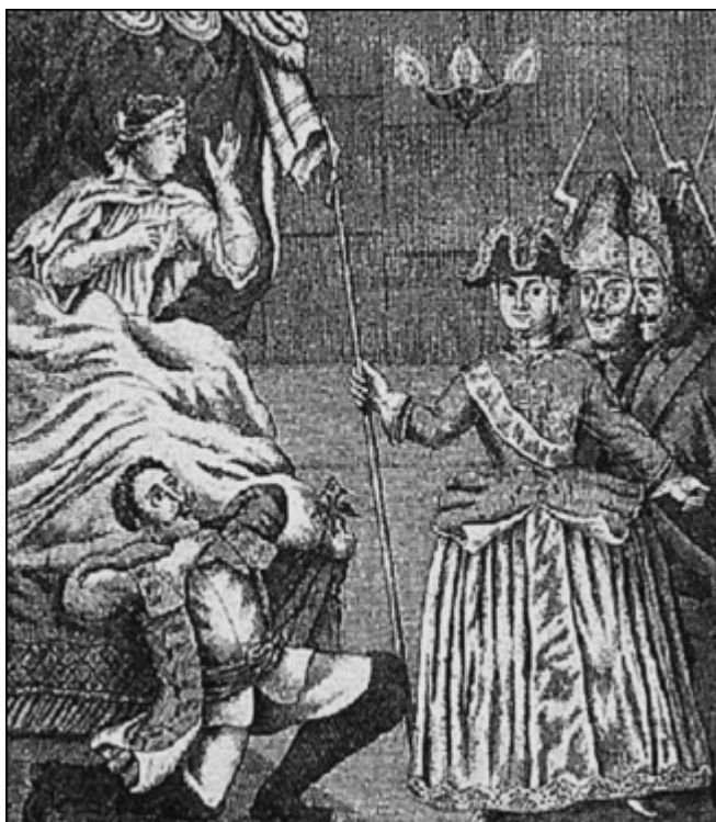
Арест правительницы Анны Леопольдовны цесаревной Елизаветой Петровной в ночь на 25 ноября 1741 г. Гравюра XVIII в.