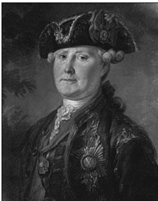
С.К. Нарышкин. Неизвестный художник