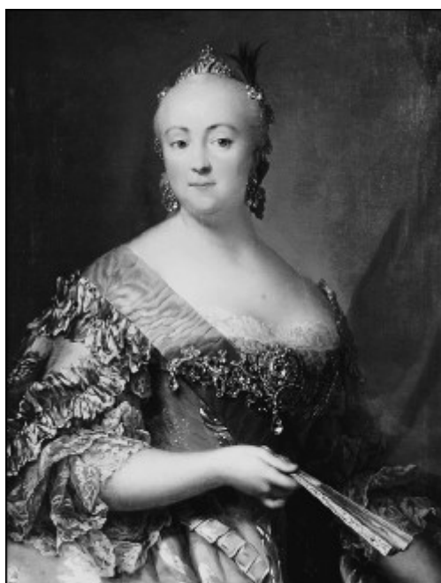
Императрица Елизавета Петровна. Художник В. Эриксен