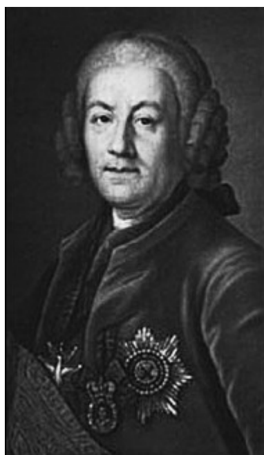
А.П. Бестужев-Рюмин. Неизвестный художник