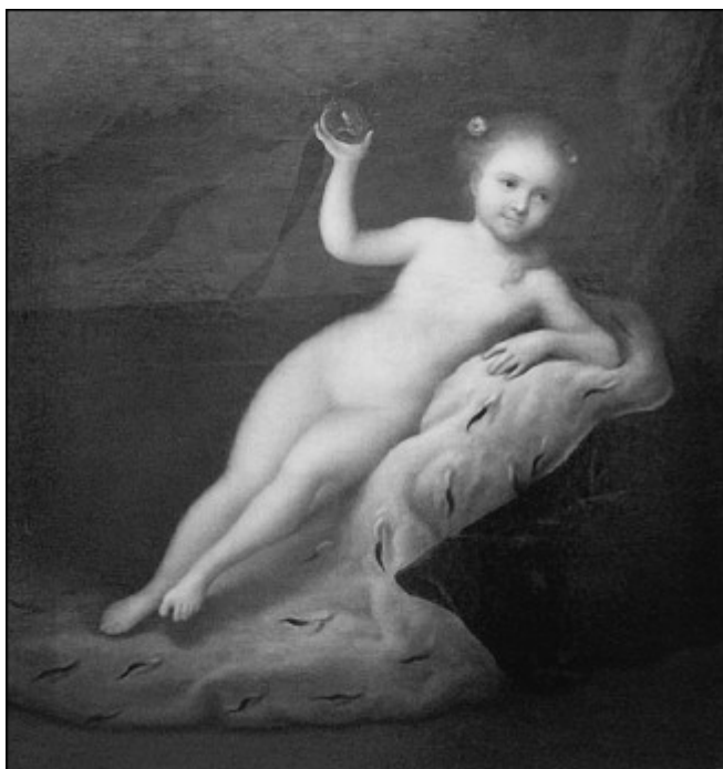
Царевна Елизавета Петровна (1709–1761) в детстве. Михайловский замок. Художник Л. Каравак