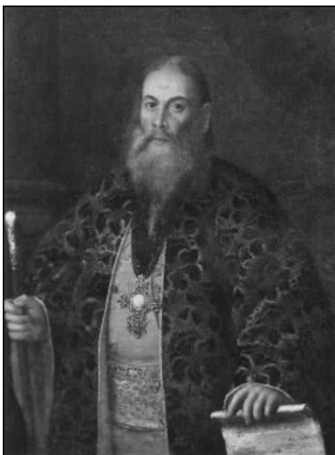
Ф.Я. Дубянский – духовник императрицы Елизаветы Петровны. Художник А.П. Антропов