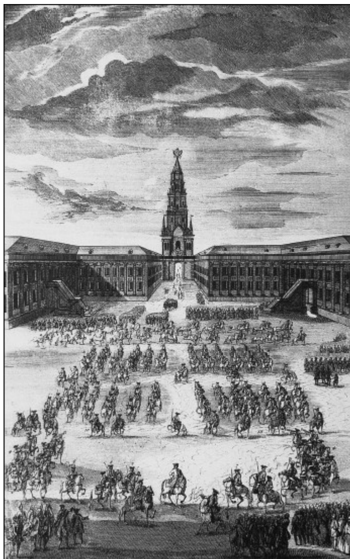
Церемония публикации перед коронацией Елизаветы Петровны в 1742 г. Гравюра XVIII в.