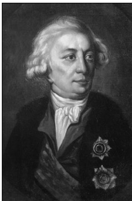
И.И. Шувалов. Художник Л. Виже-Лебрен