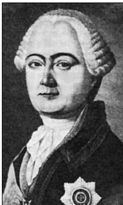
А.Г. Разумовский. Гравюра XVIII в.