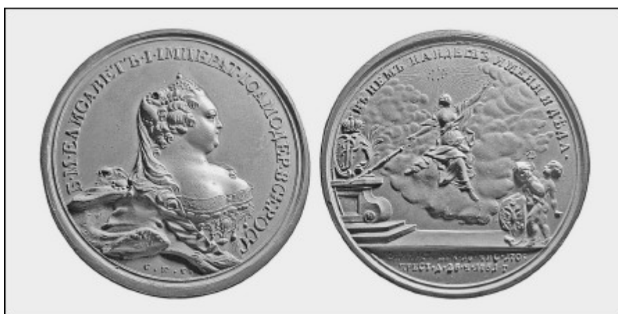
Настольная медаль на смерть императрицы Елизаветы I. 25 декабря 1761 года