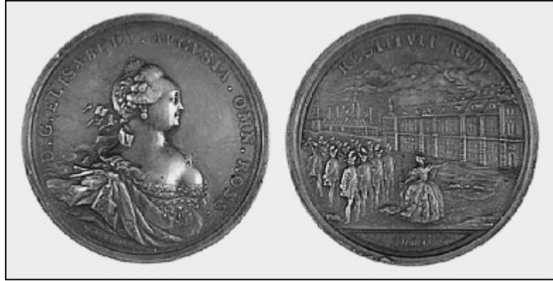
Медаль «В память восшествия на престол императрицы Елизаветы Петровны. 1741»